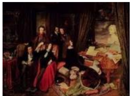
Кућни концерт у доба романтизма